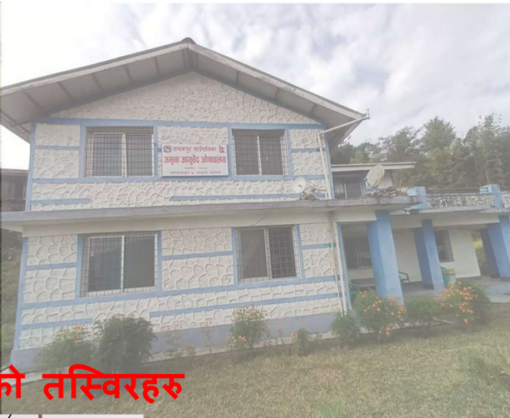
औषधालय भवन तथा जनशक्तिहरुको पहिलेको तस्विरहरु