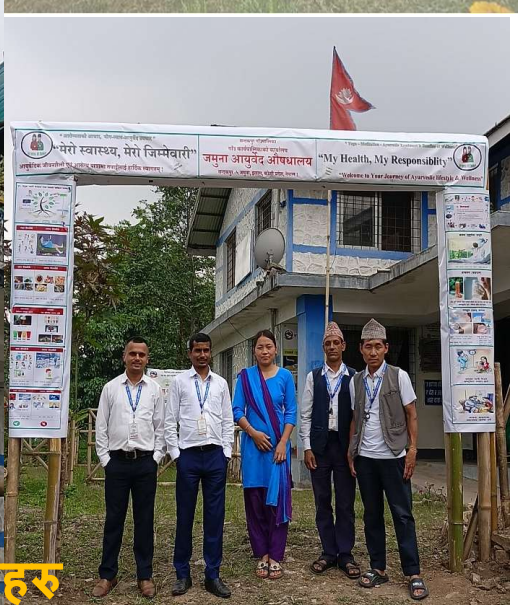
औषधालय भवन तथा जनशक्तिहरुको अहिलेको तस्विरहरु